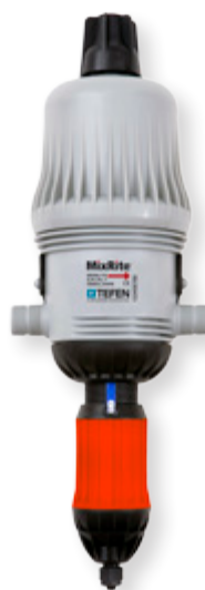
MixRite 3.5 PO (15.5 GPM)