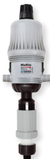
MixRite 3.5 1-10% (15.5 GPM)